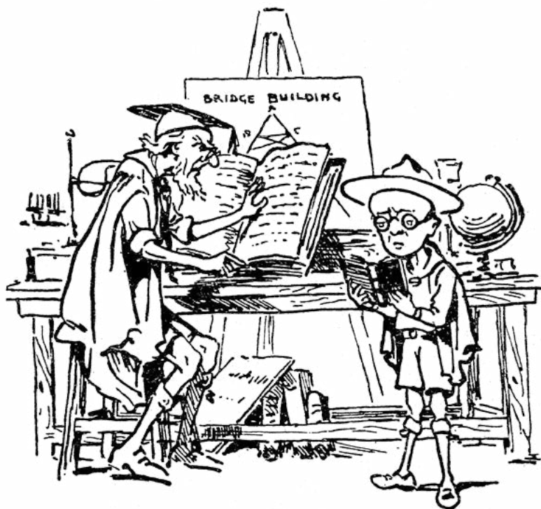
Skautybė – nesudėtingas mokslas!

Teprisimena kiekvienas draugininkas, kad be pareigų savo skautams jis taip pat turi pareigų ir skautybei kaip visumai. Mūsų tikslas – padaryti iš skautų gerus piliečius – iš dalies tarnauja krašto gerovei, kad šis turėtų tvirtą ir patikimą piliečių