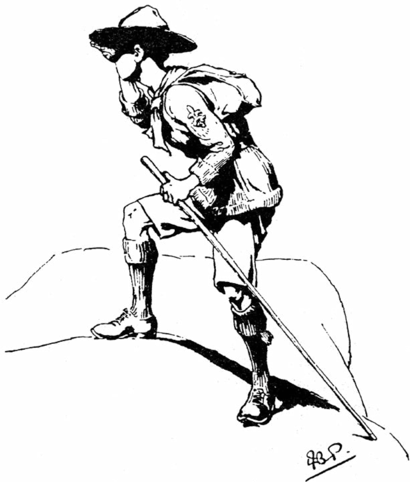
BP pirmasis skauto piešinys

Tai yra pažymėtinas, nors ir tylus, gražios patriotinės dvasios įrodymas, kuri glūdi po daugumos tautų paviršiumi. Tie žmonės aukoja savo laiką, energiją ir daugeliu atvejų savo pinigus skautų organizavimo bei lavinimo darbui niekada negalvodami apie atlyginimą ar pagyrimą už tai, ką jie daro. Jie dirba iš meilės savo kraštui ir savo giminei.